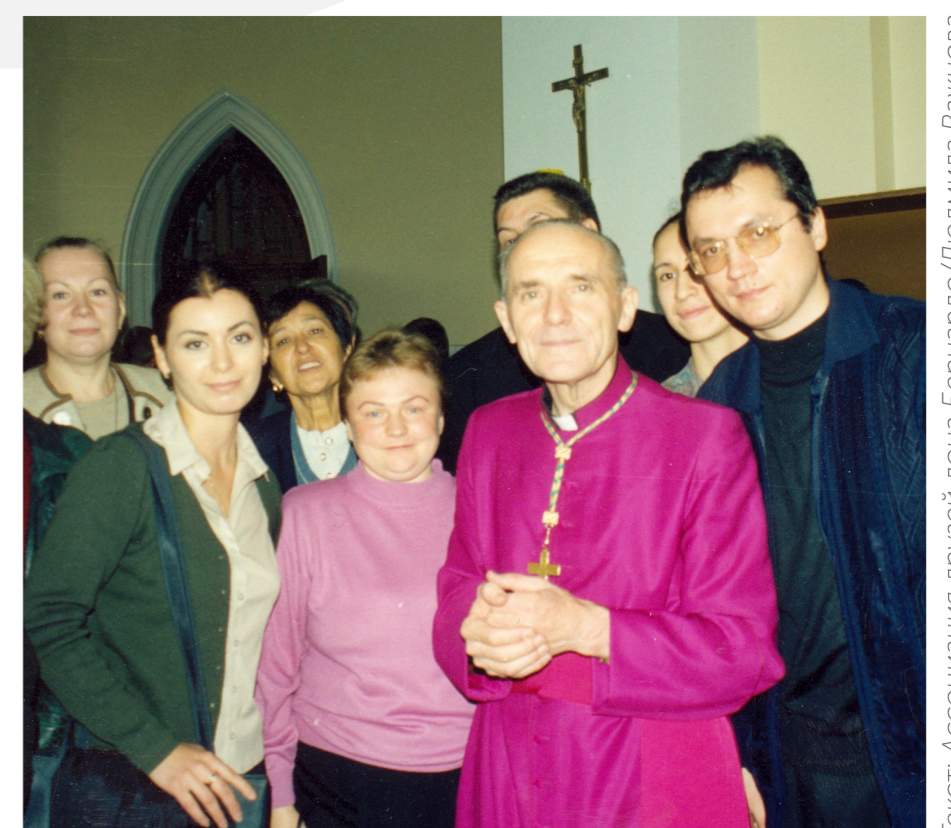
Текст: Ассоциация друзей дон Бернардо/Людмила Вайнова